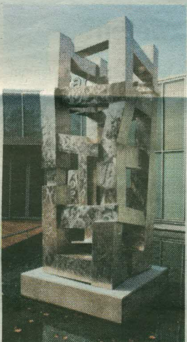
→ Donjon, roestvast staal, 400 cm hoog, 2002. Bij Rabobank, Vlijmen/Heusden.