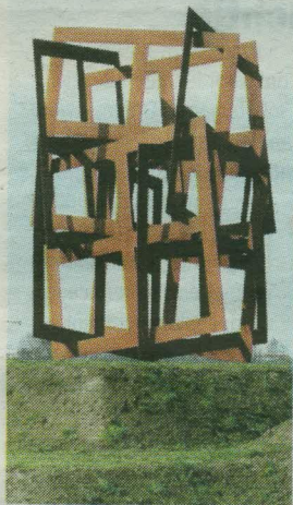
→ Running Squares, 1988, cortenstaal, Empelseweg, verplaatst naar Heinis.